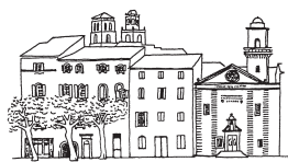
ASSOCIATION DU MÉJAN